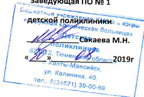
График работы медицинского кабинета:

г. Ханты-Мансийск, ул. Калинина, 40, тел.: 8(34671) 39-00-69